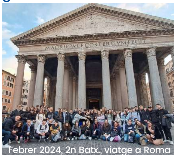
Febrer 2024, 2n Batx., viatge a Roma