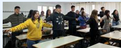
Recurs pràctiques de respiració