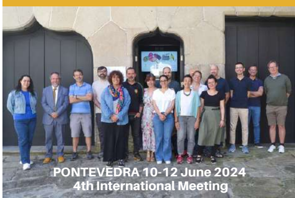
PONTEVEDRA 10-12 June 2024 4th International Meeting

A teacher professional development research project