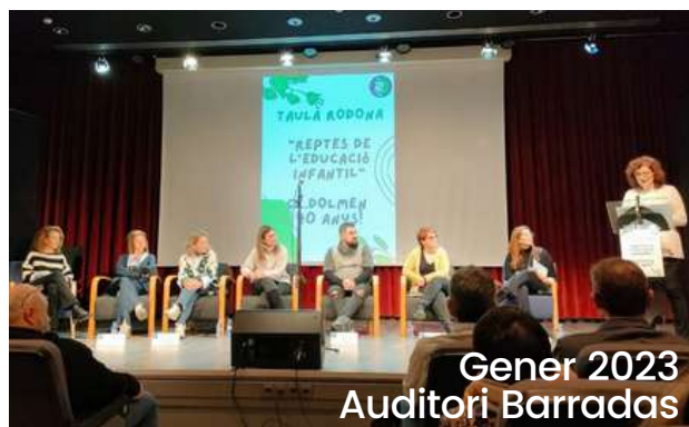
Gener 2023 Auditori Barradas

Taula Rodona amb alumnes CE DOLMEN d'Educació Infantil dels darrers 40 anys.