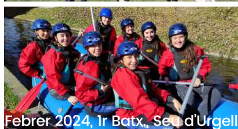
Febrer 2024, 1r Batx., Seu d'Urgell